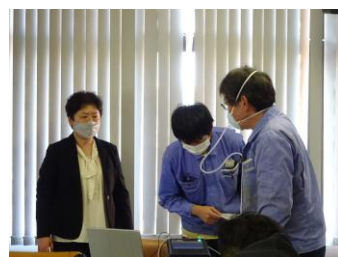
マスクフィットテストの様子。機材は協会をご用意しますので、机・電源・小スペースをご用意いただければ実施できます。

事業所の都合の良い日(良い時間帯)に短時間で実施できますので、ぜひご利用いただきたいと思っております。(交代勤務などの場合は、複数日の実施も可能です)